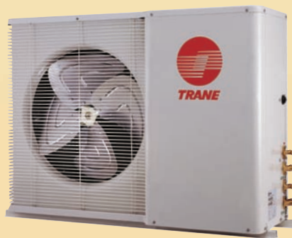
TTD518 - TTT536 18,000 - 36,000 BTUH