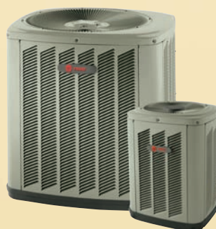
2TTB0012 a 2TTB0060 12,000 - 60,000 BTUH

¡Pregunte a su distribuidor por otras condensadoras de mayor eficiencia!