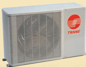
TTK512 - TTK060 12,000 - 60,000 BTUH